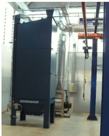
FILTRO FILTERMAX FI-90

Devido à sua experiência internacional, a SAF Holland já previu no projeto da nova fábrica sistemas de exaustão e filtragem específicos para tratamento dos fumos e gases gerados nos processos de soldagem.