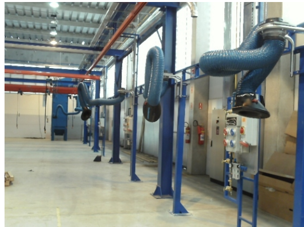
BRAÇOS EXTRATORES MODELO ORIGINAL